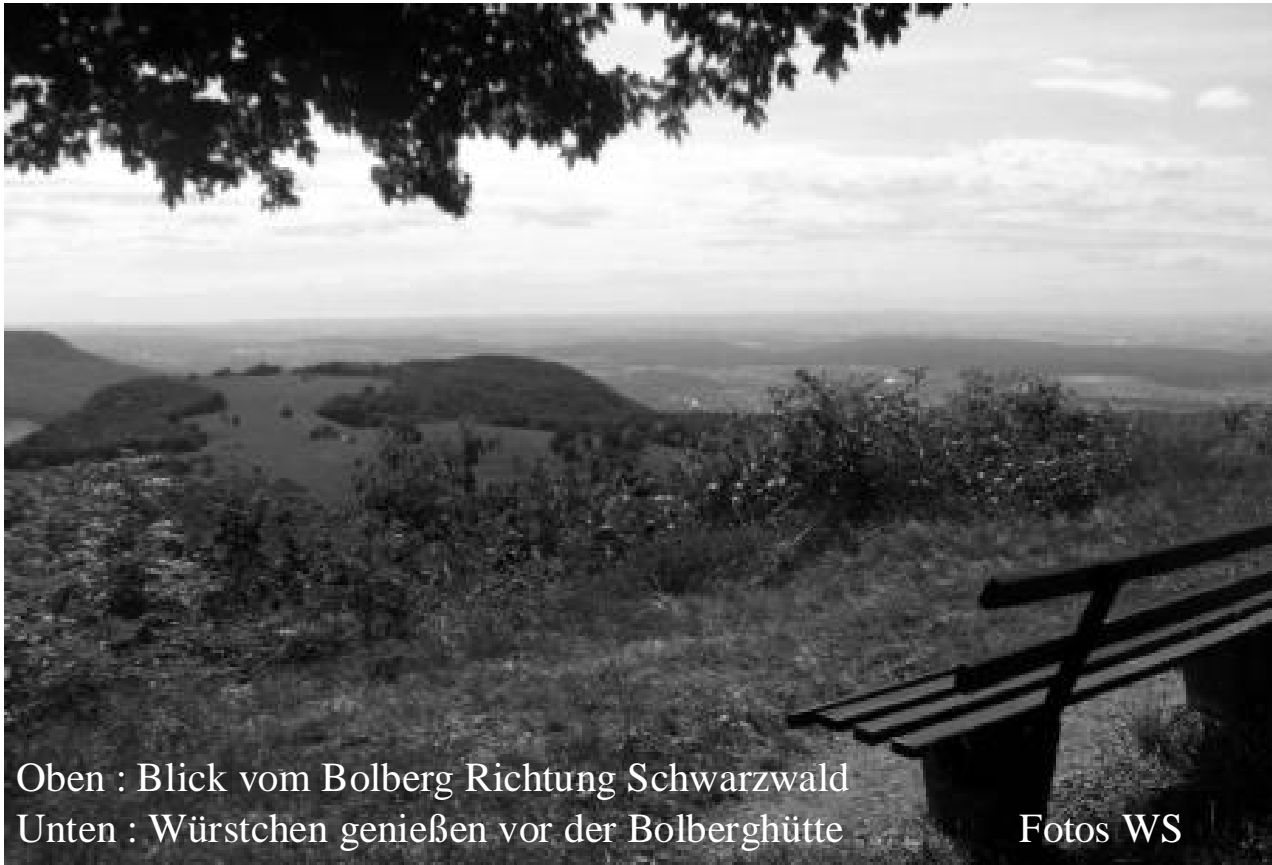
Oben : Blick vom Bolberg Richtung Schwarzwald Unten : Würstchen genießen vor der Bolberghütte